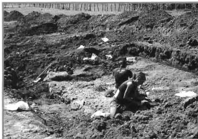
Excavación de "haizeola" en Astigarribia.

reducción no es inverosímil, pero si de imposible demostración. En cualquier caso es indudable que en Sasiola y Astigarribia se halla el vado mas adecuado del Deva: que adquirirá importancia, mas tarde, en la ruta jacobea costera".