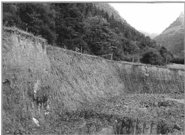
Lastur, cerca de Arruan Aundi (1989).

Precisamente en este último lugar se van a realizar en breve una catas para tratar de dar una explicación a la existencia de unas grandes losas calizas, algunas bien trabajadas, de 88 x 88 cm., lisas y talladas a bisel, situadas en el frontis del antiguo juego de pelota. Algunas de las losas poseen un agujero central, de castañuelas y son reaprovechadas de otro lugar, pero que no proceden del cercano santuario franciscano,