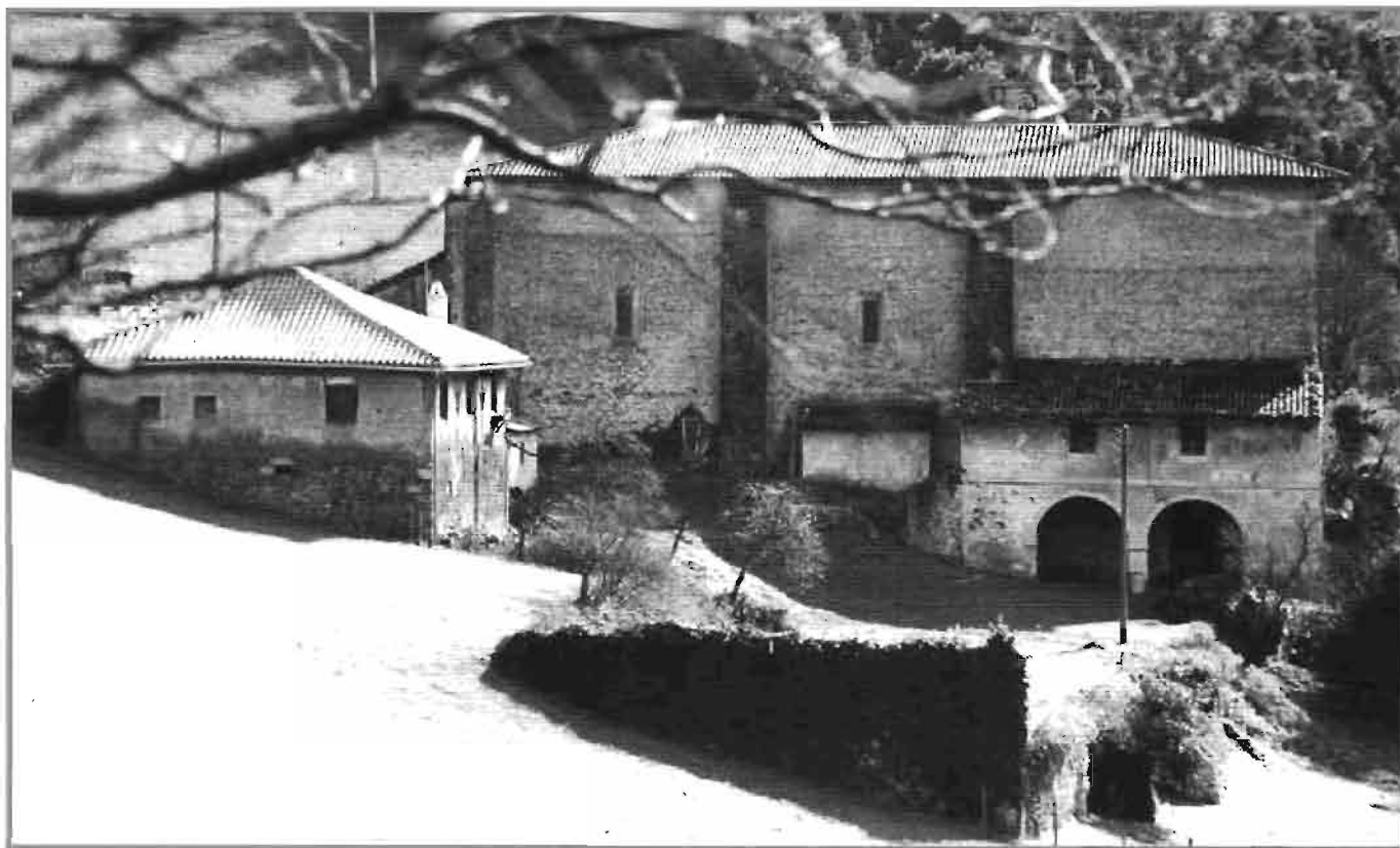
Valle del Deba. Sasiola.