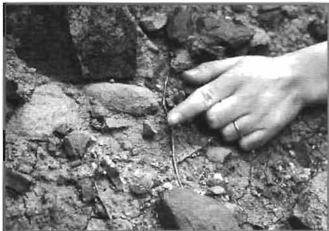
Restos de cerámica en Santa Catalina (1984).