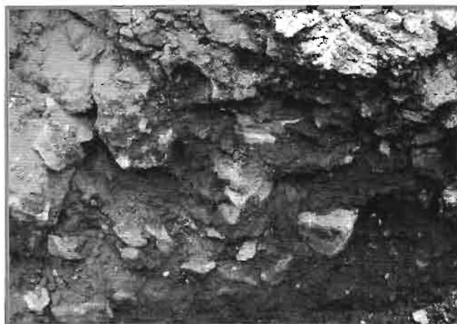
Corte de la calzada de Astigarribia..