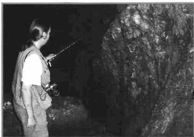
Bocamina en la ladera de Garallutz.

"Siendo la opinión mas generalizada a que reduce el Tritium Tuboricum al Motrico – Mons Tritium... ..la