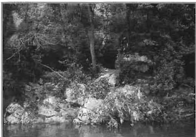
Cueva de Langatxo (Mutriku).

Indicios y mas que indicios. Después de 25 años yo creo que ahora estamos mucho mas cerca de encontrar a TRITIUM TUBORICUM. Los escasos restos romanos de Jentiletxeta II y Astigarribia, en Mutriku, los de Ermitia y Sasiola en Deba nos están invitando a soñar, a soñar con la hipótesis de que el asentamiento protohistórico estaría situado inicialmente en alguna cercana loma elevada, y que después esas gentes bajarían a establecerse a orillas del río, quizás en ambas orillas del vado, para abastecer de agua potable a las nuevas gentes que habrían llegado por mar con la ruta de cabotaje y cuando estos últimos se retiraron, entonces, los indígenas se volvieron a sus tierras altas, para asentarse en forma de pequeños núcleos de población dispersa, quedando para la posteridad el hidrónimo no euskérico que todos conocemos: DEBA. La arqueología refutará o demostrará la hipótesis ahora expuesta.