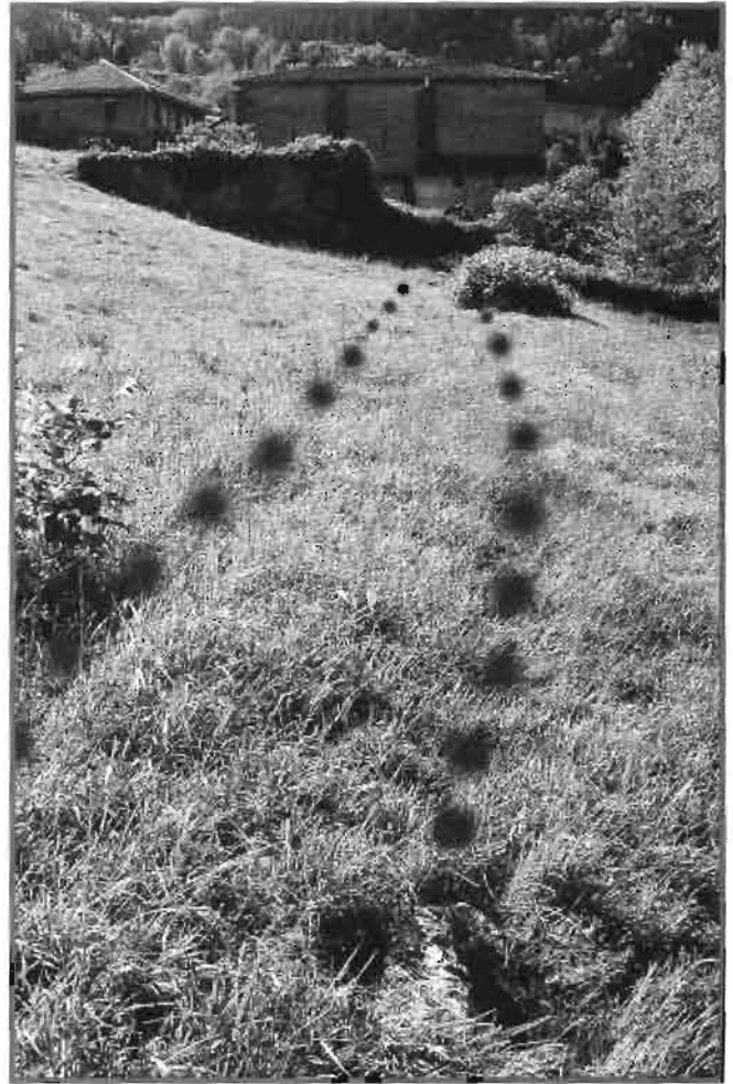
Posible calzada en Sasiola.