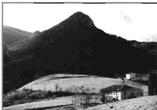
Zona de Murgi, Lastur. Al fondo el monte Gaztelu (2000).

He encontrado que IRI es a veces una Villa, otras un barrio, otras una sola Casa y de vez en cuando, sólo está la fortaleza. Parece una contradicción, pero no lo es: IRI siempre es la fortaleza, los únicos que en la Protohistoria nuestra hicieron fortalezas en las alturas, fueron los indoeuropeos y dentro de esas fortalezas hicieron sus viviendas.