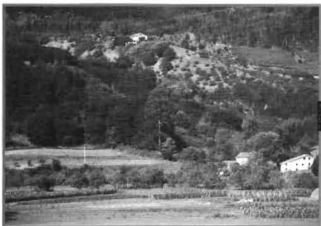
Zona de Lasao (1998).