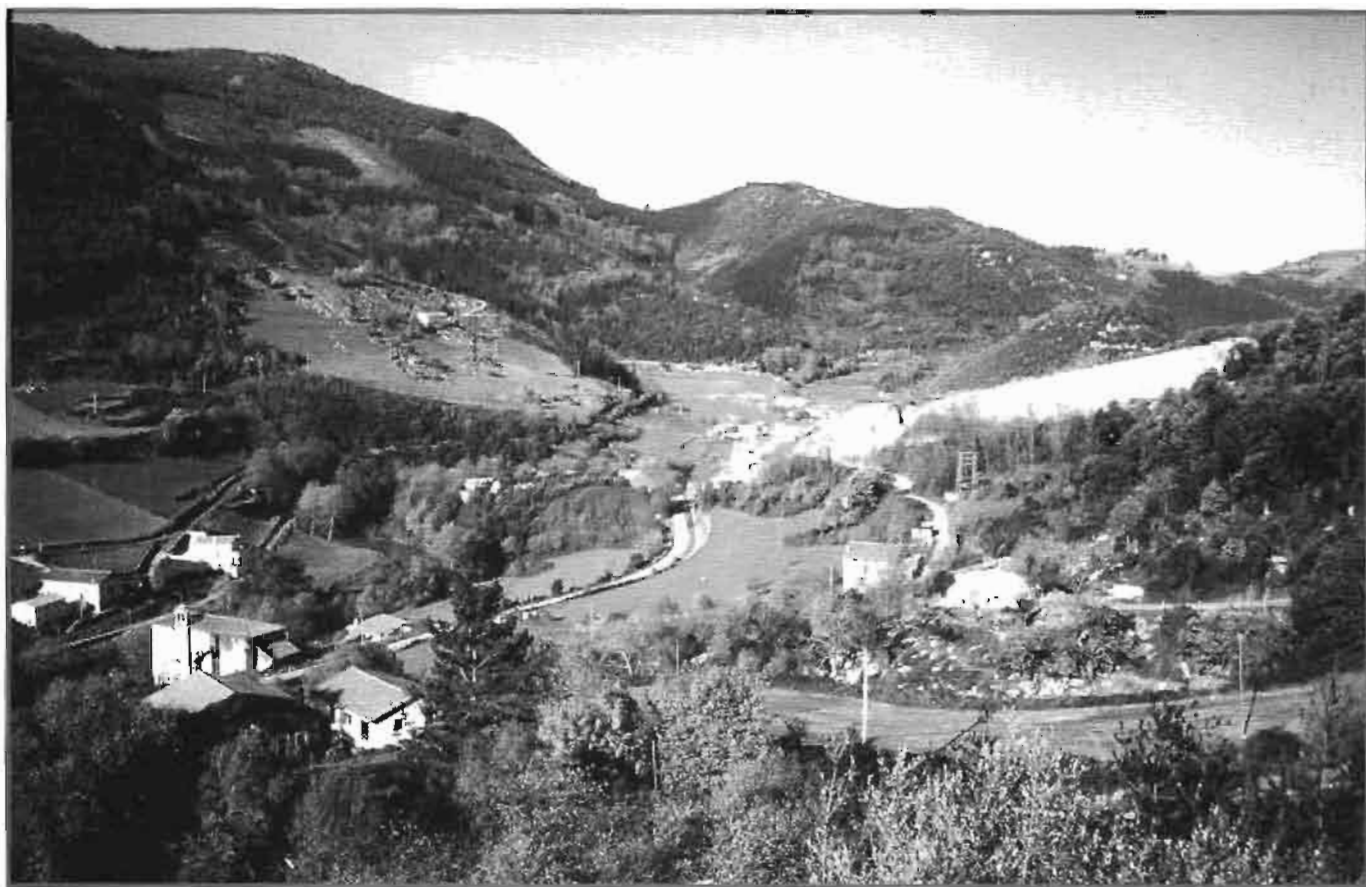
Valle del Deba (1999).