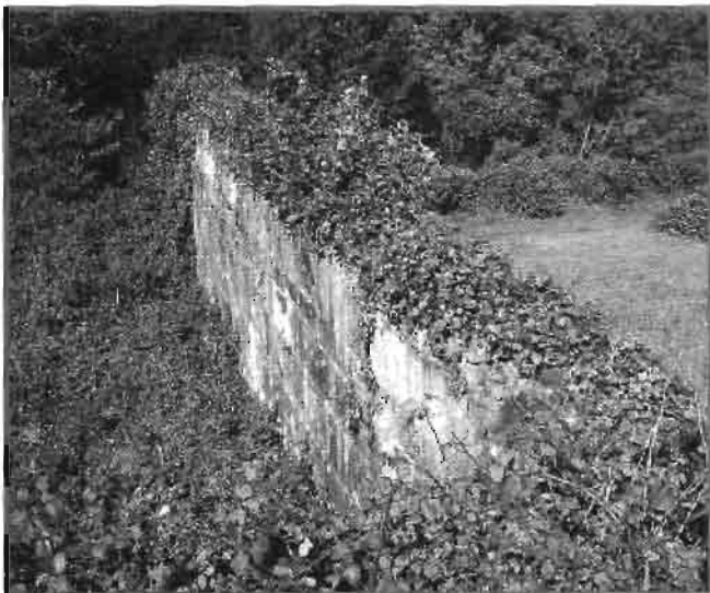
Muro del juego de pelota en Sasiola.

Lo indudable es que la calzada no fue construida para el paso de los peregrinos, sino que sería utilizada por estos años mas tarde. No olvidemos la existencia del topónimo de Miruaitz, cercano a zona de Mendibeltzu-Ziñua, con la presencia de un extraño muro, trabajado con grandes piedras sin argamasa, que recorre su cima y donde en la cercana cueva de Jentiletxeta II apareció una hebilla de cinturón de factura tardorromana y alguna cerámica de tradición indígena (J.M. Barandiaran, 1936).