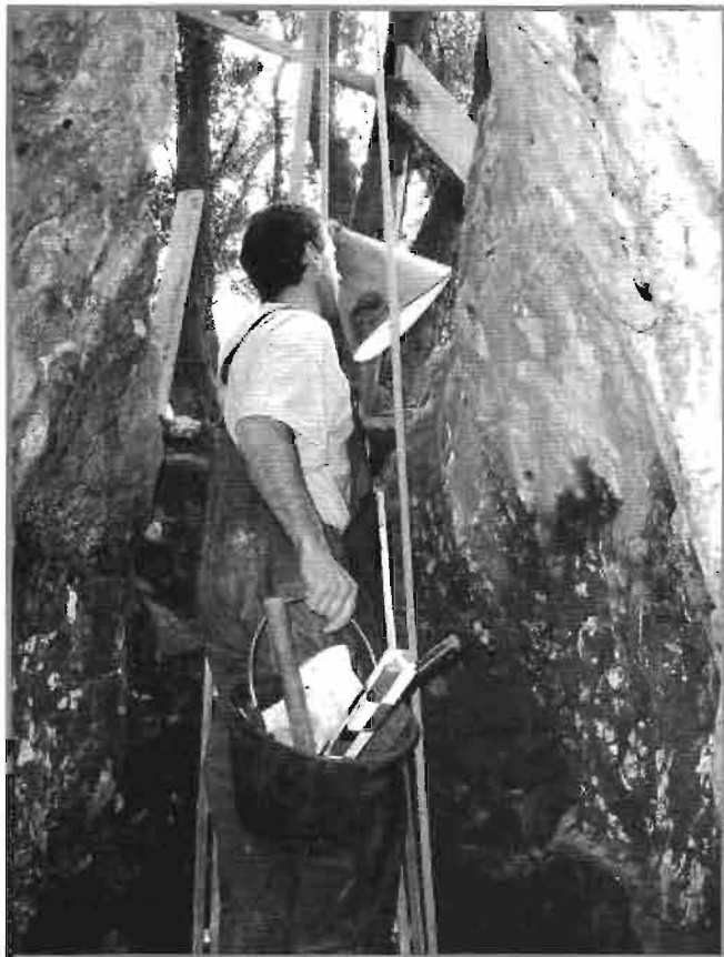
Yacimiento de Kiputx (Mutriku).

Lugares como Urkulu, Irubixa, Albizuri, Mirubixa, Murgia, Miruaitz, Munatxo o Burgaño están esperando respuesta.