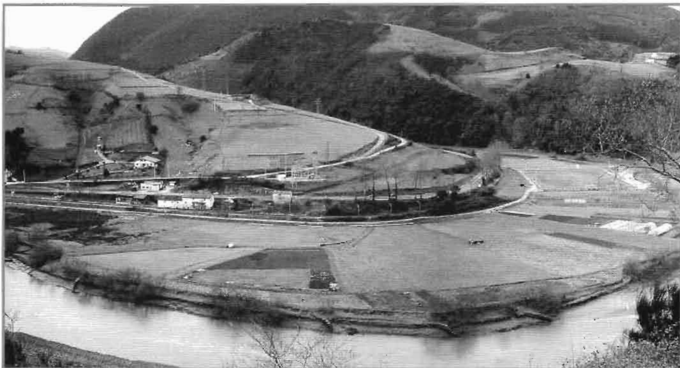
Valle del Deba.