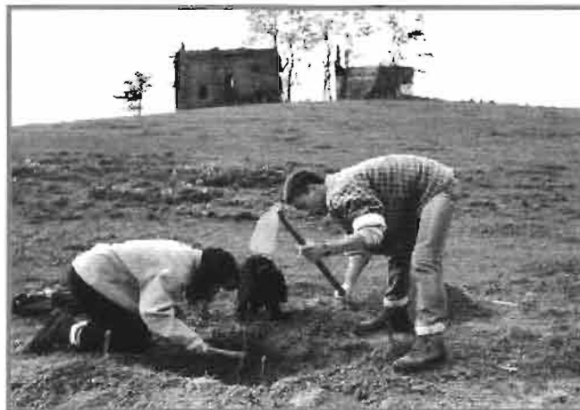
Catas en Santa Catalina (1995).