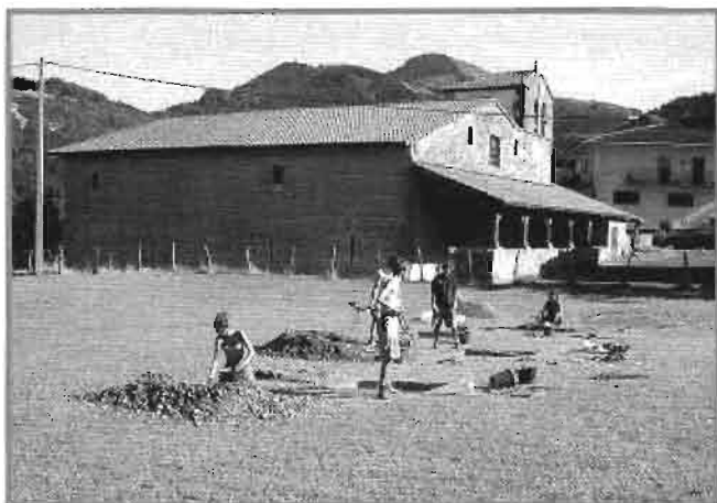
Excavaciones en Astigarribia.