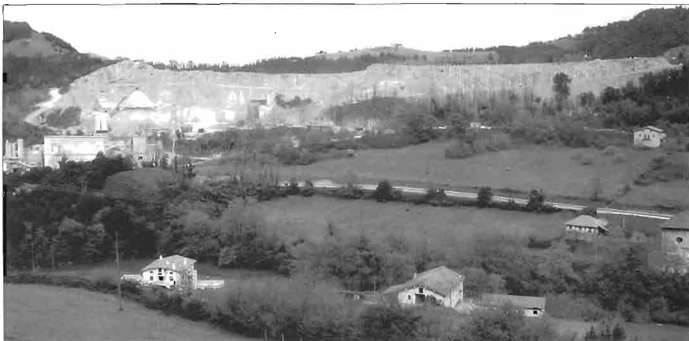
Cantera de Sasiola, 16 de abril de 2008