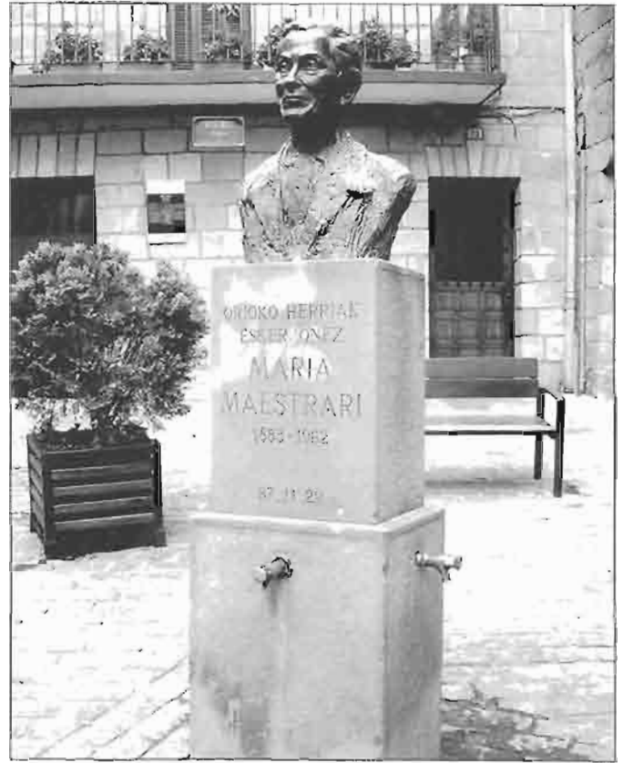
Fuente en la plaza Pilliku de Orio.