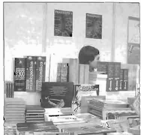
Poster sobre Praileitz en un stand de la Durangoko Azoka (07-12-2007).