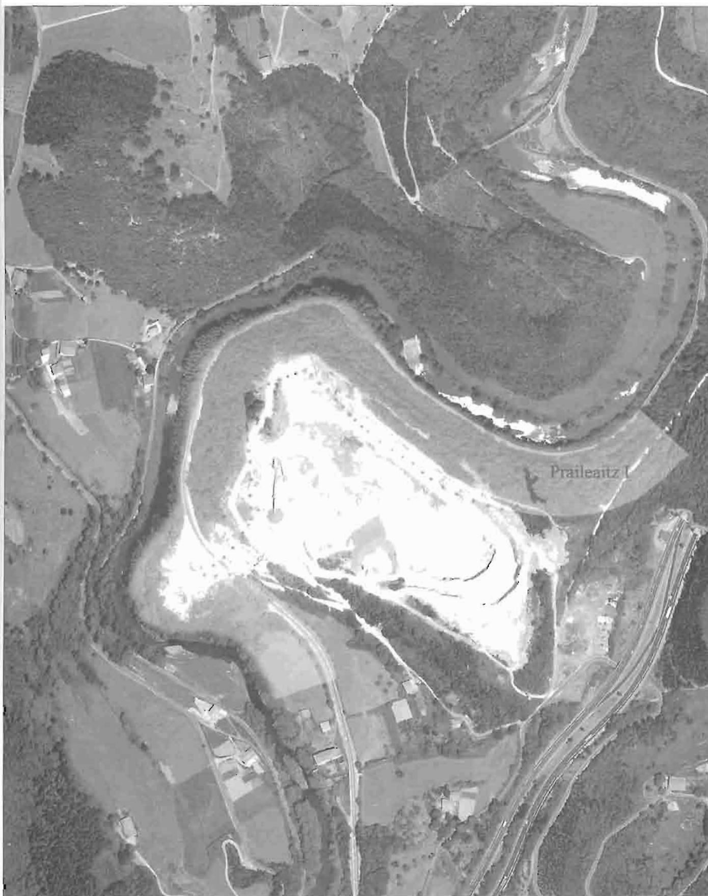
Foto aérea de la zona de Sasiola, con indicación de la afección al ámbito costero (año 2005).