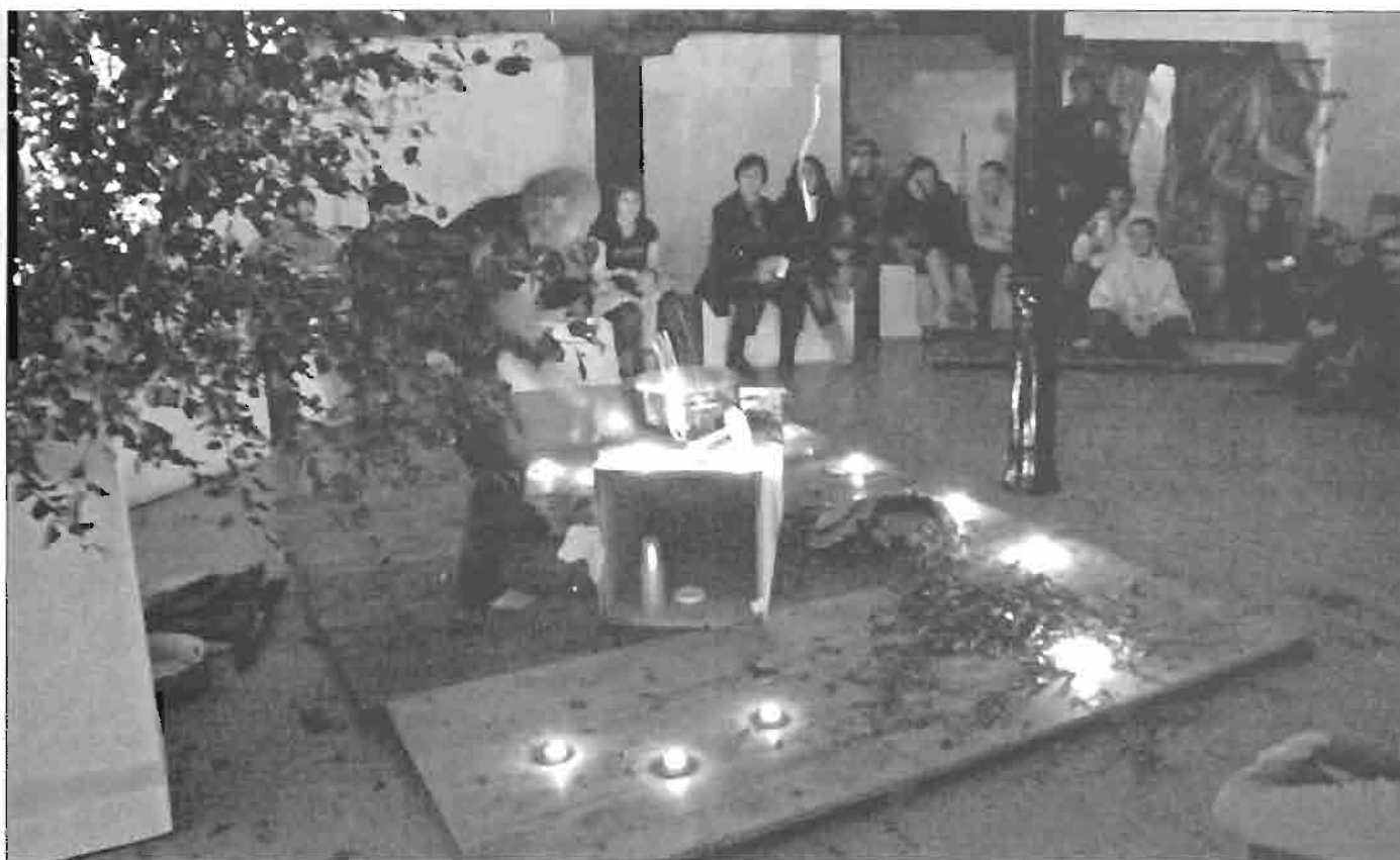
Representación teatral de rito txamánico realizada en Zumaia.