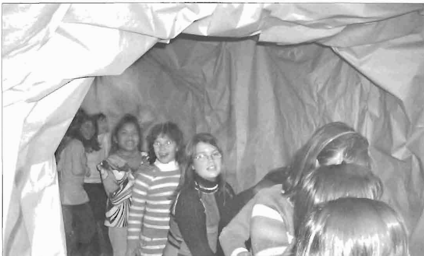
Participación de alumnos de primaria en Deba.