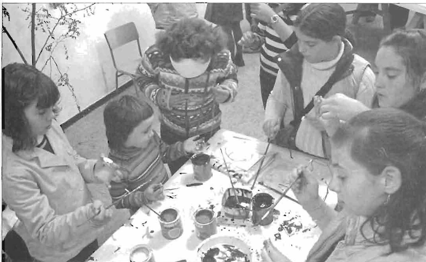
Actividad con niños realizada en Zumaia.