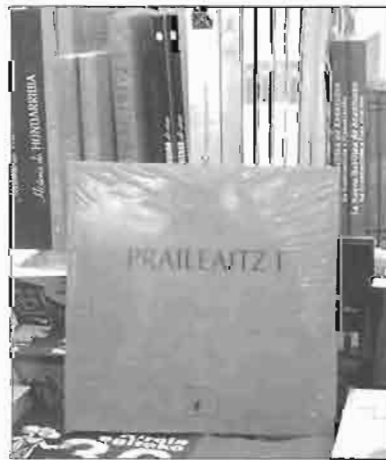
Libro "Praileitz I" en la 42ª edición de la Durangoko Azoka (07-12-2007)