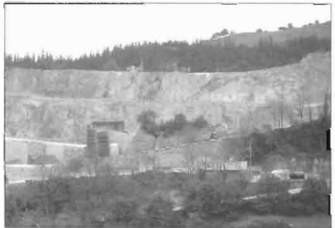
Dos máquinas perforadoras trabajando sobre la zona alta, preparando una voladura (12-11-2007)