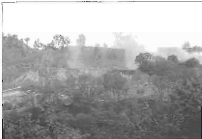
Voladura del 11-09-2007.