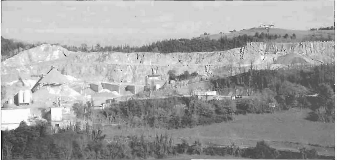
Situación de la zona el día de la patrona Santa Barbara (4-12-2007).