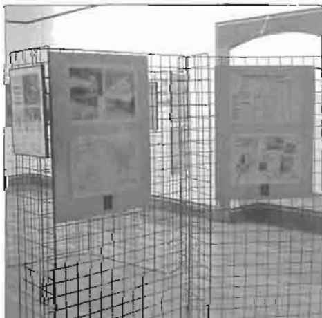
Exposición celebrada en Mutriku (Zabiel Elxea)