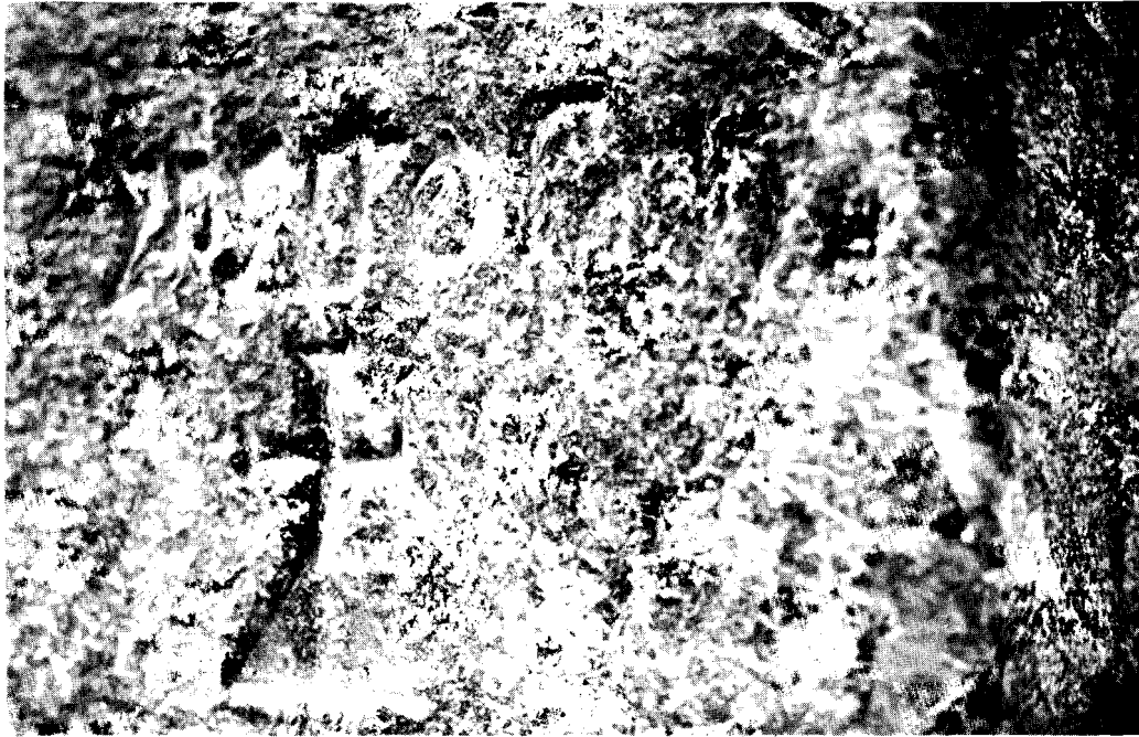
Fotografía de la Cruz N° I e inscripción

«Breve aportación a la historia del Bajo deba. III»