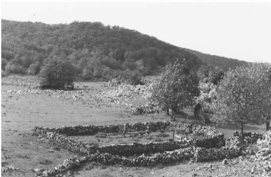
Antigua "etxabola" de Dominika Arrizabalaga en la majada de Oltzeko zelaia en el macizo de Aitzgorri - - Gipuzkoa 131096