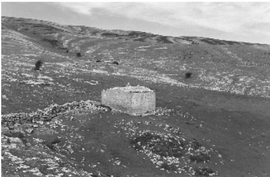
Cabaña de pastores "Riberos" en la majada de Carabineros. Sierra de Andia - Navarra Fot. F.L. 0996