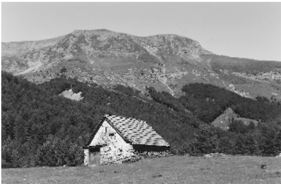
Borda Garcés en Izaba (Erronkari-Nafarroa) Fot. F.L. 150996