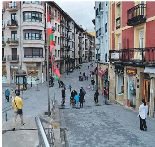
Beasaingo kaleak lasai, festa-giro handirik gabe. K. GARRALDA ZUBIMENDI

«Ez-jairik ez dago», azpimarratu dute. «Hortaz jabetzea herri-ritar, ostalari, merkatari, elkarre, herri-eragile... bakoitzak bere eremuan, guztion erantzukizuna da». Udalak bere eskumenekoak diren baliabideak martxan jarriko dituela iragarri du, hala,