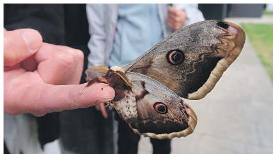
Oianguko Txiringitoan agertu zen Saturnia Pyri sitsa. A. VIERBÜCHER

Egurrezko etxetxo baten itxura du hotelak, eta barruan, hainbat gelatxo ditu. Oianguko sagastian dago kokatuta eta edonor gerturatu daiteke bertaraino. «Mo-