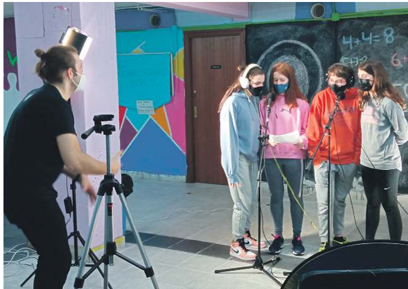
Legazpiko Eit point taldeko neskek Gazte-txokoan bideoa grabatzeko unean.

LEGAZPI // Udalak bere web orriari zintzilikatu ditu maiatzaren 1eko Santikutz Klasikoaren txirindularitza probako argazkiak (79 guztira), eta maiatzaren 3ko ezpata-dantza ekitaldiko irudi bilduma (138 argazki). Irudi guztiak Josu Altzelai argazkilaria legezpiarrarenak dira, eta legazpi.eus webgunean ikus daitezke.