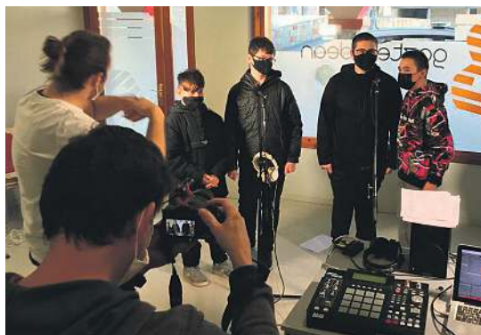
Urretxuko Gazte Bidean zerbitzuko beat-eroak. GAZTE BIDEAN

Rap musikaren bitartez, gazteen euskara zeharka eta era dibertigarrian lantzea da Beat-eroak proiektuaren helburua. Hainbat fasetan garatu da, eta partaideak errekrutatzen abiatu zen, udaberriarekin batera. Legazpiko Nerabeentzako Zer-