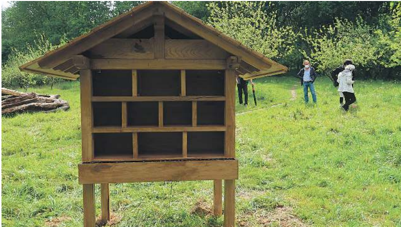
Eskaralimania intsektuen hotela jarri dute Ordiziko Oiangu pakean. A. VIERBÜCHER