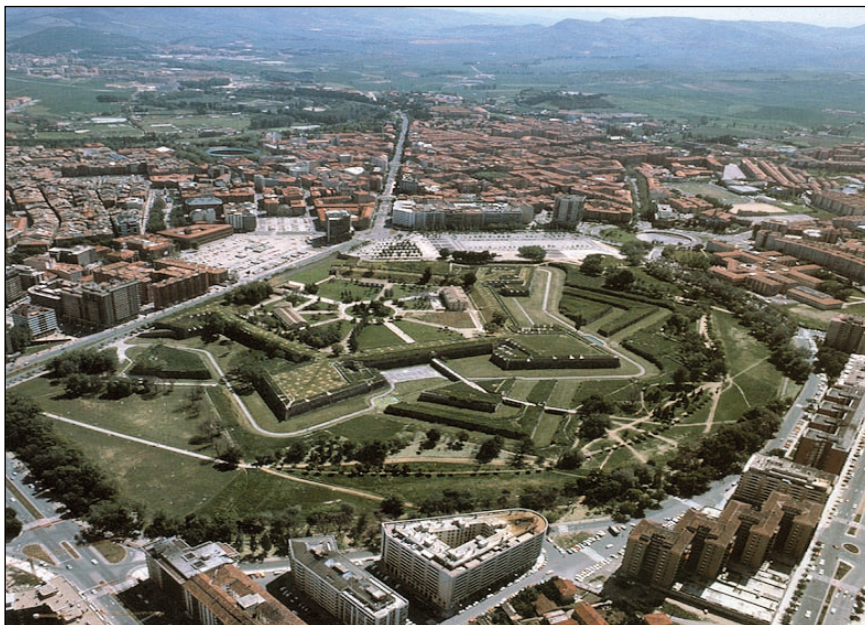
Figura 1.- Panorámica de la Ciudadela