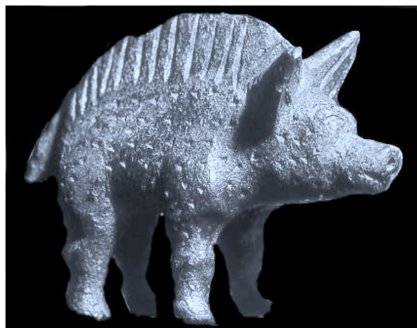
Fig. 6 : Statuette en bronze de sanglier de l'oppidum du Titelberg au Luxembourg

l'est de nos jours en France. Le contraste est saisissant lorsque l'on considère le bestiaire iconographique, tel qu'il nous est parvenu notamment sous forme d'objets métalliques. En effet, le sanglier est représenté par des statues, des statuètes (fig. 6), des enseignes ou sur des monnaies, selon divers répertoires, dans diverses régions et périodes. Beaucoup de ces représentations sont bien connues et ont retenu très tôt l'attention d'archéologues sensibilisés à l'importance particulière de l'animal chez les Gaulois. Beaucoup de ces représentations, pour celles qui sont datées, sont assez tardives et n'apparaissent guère avant le IIe siècle avant notre ère. Nul doute que la place particulière de cette espèce dans l'iconographie, qui si elle cède la première place au cheval , est à l'image de celle qu'elle occupe et qu'elle contribue sans doute à entretenir dans l'imaginaire des Gaulois. Elle doit beaucoup à l'image de courage et de valeur que sa chasse revêtait.