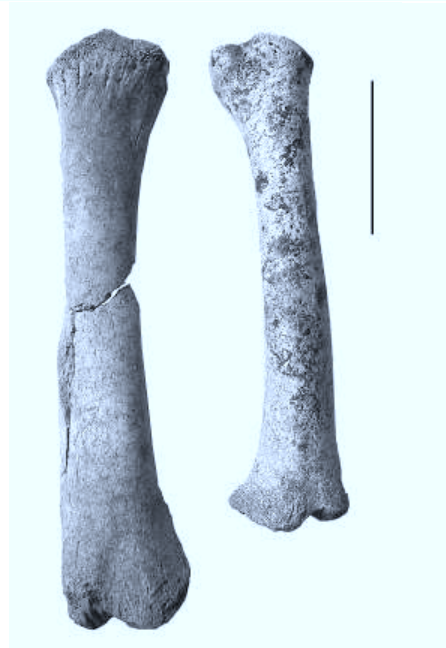
Fig. 2: Radius de porc et de sanglier du dépôt d' Ouessant "Mez Notariou" (l'échelle est de cinq cm).

Les conditions d'élevage des porcs sont difficiles à restituer, seuls quelques rares indices permettent d'en évoquer quelques aspects. En l'absence de porcheries reconnues en tant que telles, les lieux d'élevage restent dans l'ombre. Ces animaux ont pu vivre en semi-liberté dans les villages ou les établissements ruraux; cela pourrait être une des justifications de la délimitation de ces établissements par divers systèmes de clôtures, palissades ou autres (MALRAIN et al. , 2002). Leurs allers et venues ont également pu être limités par des liens ou des attaches dont on constate parfois les effets sur le squelette sous forme d'anomalies, d'excroissances ou de déformations au niveau du tibia et de la fibula.