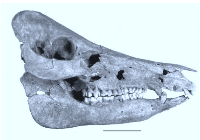
Fig. 5: Traces de brûlures sur des dents de porc (l'échelle est de cinq cm).

Les traces de cuisson sont habituellement difficiles à déceler au sein des brûlures qui affectent des os exposés ou rejetés dans un foyer, et qui atteignent des degrés qui dépassent souvent ce qui relève de la simple cuisson de la viande. Les traces de cuisson ne sont pas toujours très évidentes et il faut un mobilier très bien conservé pour qu'elles puissent être décelées. Les indices d'une exposition à la flamme sont souvent visibles sur les pointes des incisives et des canines, ainsi que sur les extrémités distales des talus (fig. 5). Ces traces peuvent résulter du grillage des soies avant la découpe, ou à la cuisson elle-même. Le degré de l'altération montre que, dans la majorité des cas, nous avons affaire à une cuisson, dont les effets ont pu se superposer à ceux d'un grillage préalable. La localisation de ces brûlures montre que nous avons affaire à des porcs cuits à la bro-