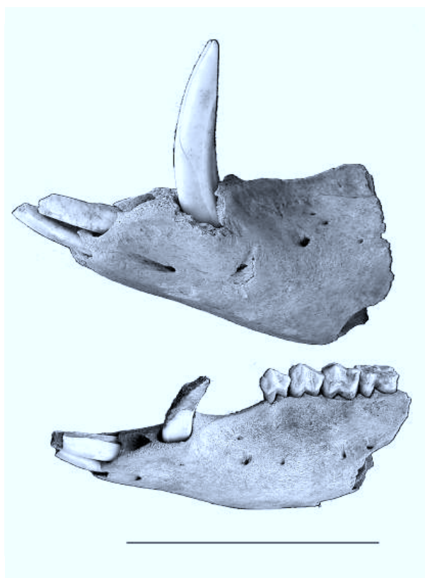
Fig. 1: Fragments de mandibules de sanglier (en haut) et de porc (en bas). Les différences de dimensions assurent une distinction nette entre les deux animaux. La canine du porc a été exposée à la flamme (l'échelle est de cinq cm).

C'est ainsi qu'au Musée de Châtillon-sur-Seine sont conservées quelques caisses de vestiges animaux issus des fouilles menées pendant un siècle, entre le XIXe et le XXe, sur l'agglomération gallo-romaine de Vertault. Ces ensembles, manifestement sélectionnés à la fouille selon des critères tout à fait particuliers, avec une nette préférence pour les restes animaux présentant des formes aigues (andouillers, chevilles osseuses, canines de suidés, et pour les oiseaux, des crânes et des tarso-métatarses avec ergot...), comportent une part importante de canines inférieures de porcs domestiques, de verrats pour l'essentiel (98,3 %). Or, dans les journaux de fouille, ces dents sont systématiquement désignées comme défenses de sangliers. Mais leurs dimensions sont largement insuffisantes pour permettre une telle attribution (fig. 1).