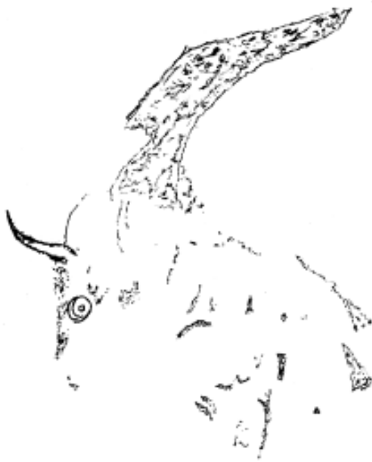
Fig. 2. Bisonte 2 del Grupo de la sima.

da. En la cabeza se ha dibujado un cuerno completo, con las dos curvaturas típicas, la proximal, con la concavidad hacia adelante y la distal, con la concavidad hacia atrás (Foto 2). Para el ojo se ha elegido un hoyo natural de la roca. La giba lleva también una mayor carga de pintura, como hemos visto en el bisonte anterior y se observa también en otros bisontes pintados de esta cueva, en especial en los Grupos II, IV, V y VII.