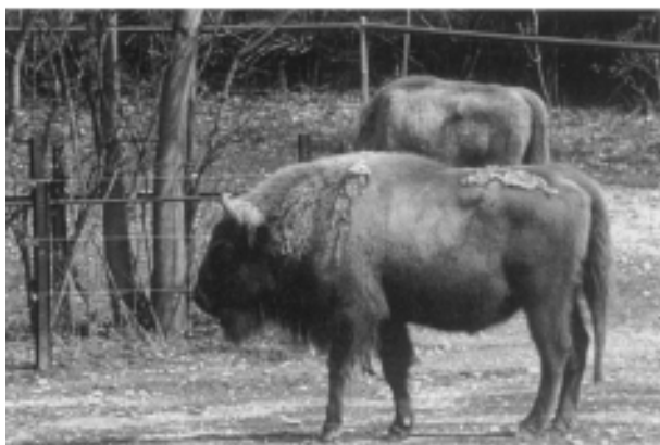
Foto 2. Bisonte europeo actual

La giba conserva mejor la pintura, sin duda por haber sido aplicada con más profusión sobre ella, para indicar el pelaje de esa zona (Foto 2). Siguen dibujados con gracia, el lomo, la grupa y las nalgas. No se aprecia con seguridad la cola, en el estado actual de la pintura, a menos que se aproveche una línea de concreción existen delante el