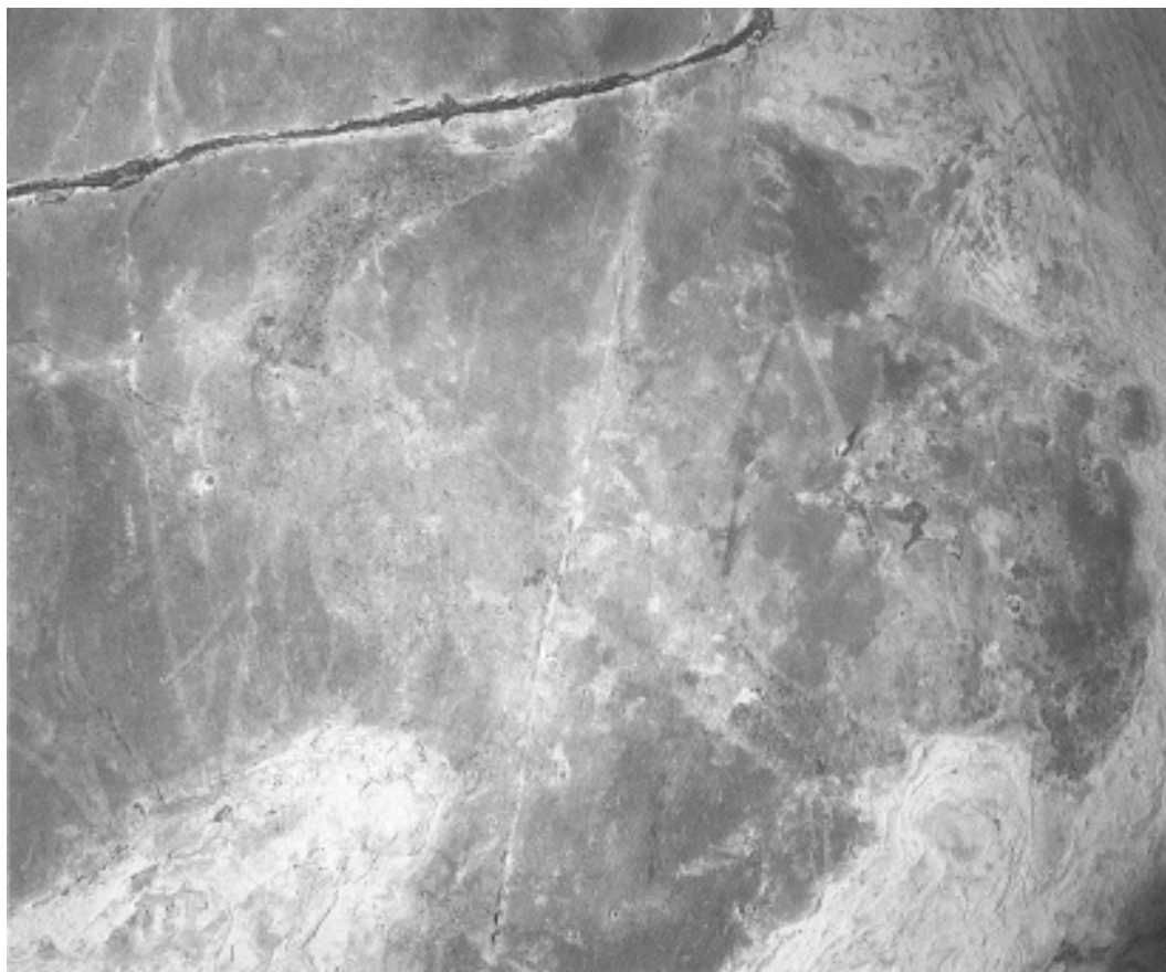
Foto 4. Bisonte 2 del Grupo de la sima.