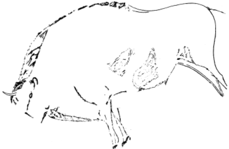
Fig. 1. Bisonte 1 del grupo de la sima.