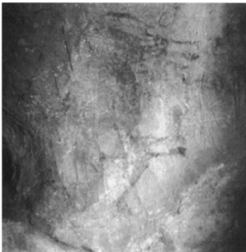
Foto 3. Bisonte 7 del Grupo IV.

Inmediatamente detrás de la figura anterior y realizada de la misma manera, queda la parte anterior y giba de un segundo bisonte. No se advierte nada del cuerno trasero, ni de las patas anteriores. La pintura está más perdida aun que en el caso anterior. Está dirigido, como aquél, hacia la izquier-