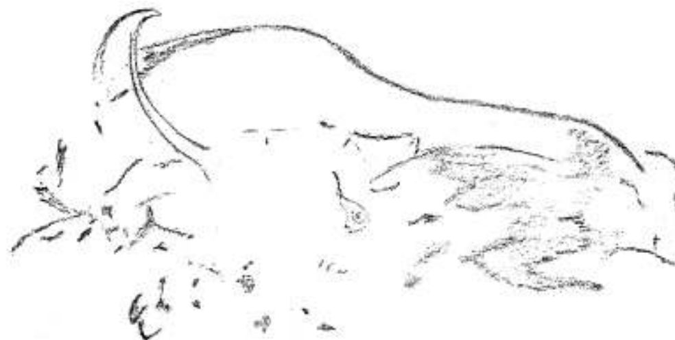
Fig. 3. Conjunto de pinturas rojas de la galería superior.