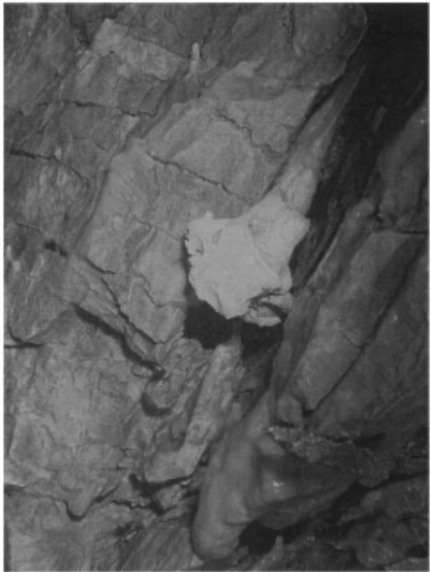
Foto 6. Vértebra dorsal de bisonte

A pocos metros de estas pinturas hay una vértebra dorsal de bisonte clavada intencionalmente en una grieta de la roca por su apófisis espinosa (Foto 6). Sólomente queda fuera el cuerpo vertebral. Toda ella está cogida con concreción estalagmítica. Alguien debió de intentar arrancarla y rompió la mitad de dicho cuerpo. El color blanco actual, que muestra la parte esponjosa del cuerpo, indicamente la rotura moderna.