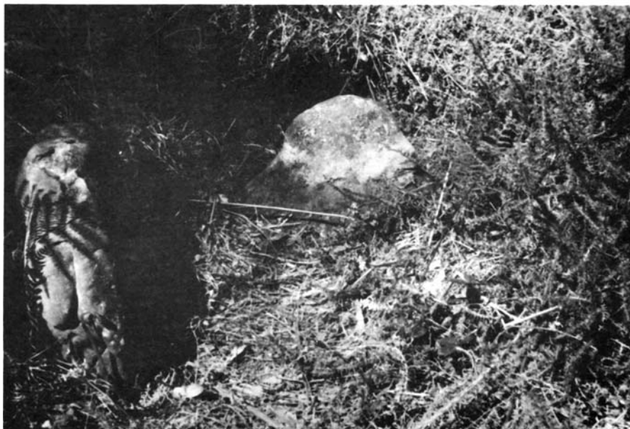
Foto 2. Dolmen de Saierrikolanda II.