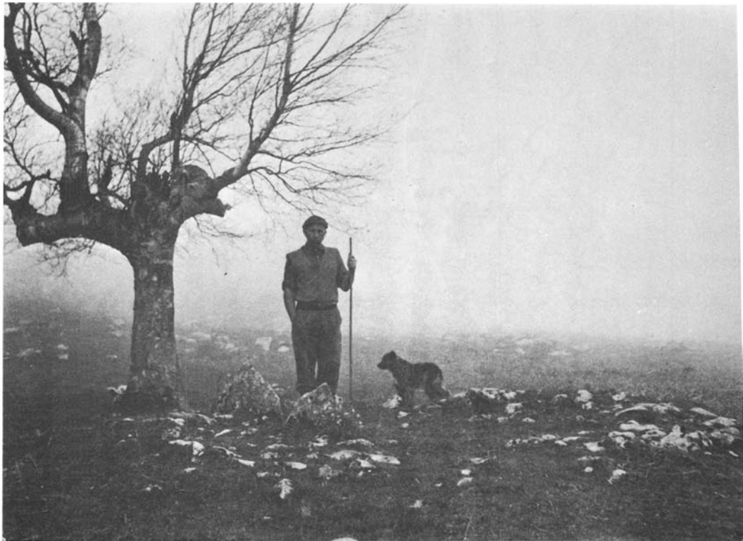
Dolmen de Zain-go ordeka