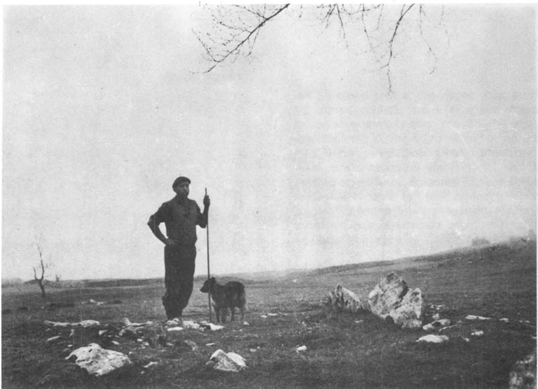
Dolmen de Zain-go ordeka